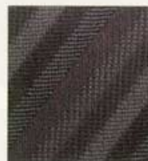
Platin/Blizzard Diagonal 39